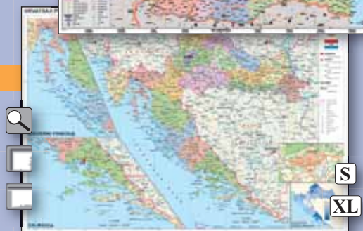
▲ 89318 Horvátország közigazgatása