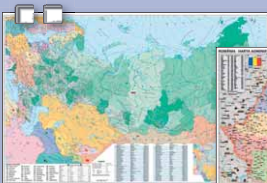
▲ Oroszország közigazgatása