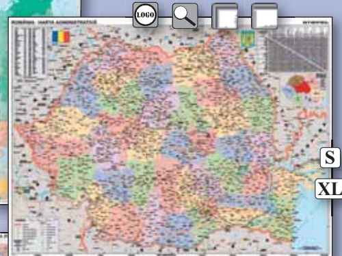
▼ 3890217, 890217 Románia közigazgatása