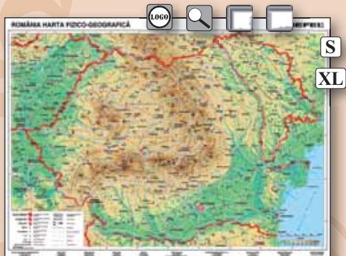
▲ 47410 Románia domborzata