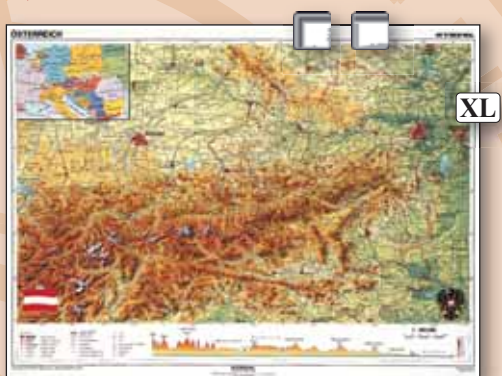
▲ 60210 Ausztria domborzata