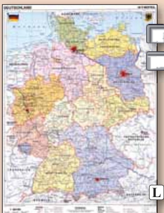
▲ 27550 Németország közigazgatása